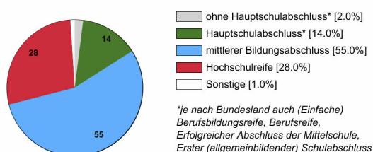
Ausbildungsanfänger/innen 2022 (in %)

Rechtlich ist keine bestimmte Schulbildung vorgeschrieben. In der Praxis stellen Betriebe überwiegend Auszubildende mit mittlerem Bildungsabschluss ein.