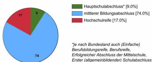
Ausbildungsanfänger/innen 2022 (in %)

Rechtlich ist keine bestimmte Schulbildung vorgeschrieben. In der Praxis stellen Verwaltungen und Betriebe überwiegend Auszubildende mit mittlerem Bildungsabschluss ein.